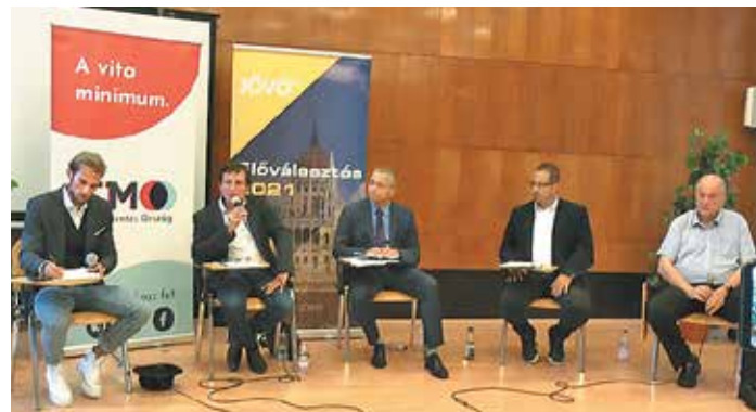
A XVI. kerületet is magába foglaló 13. képviselői körzet ellenzéki jelöltjeinek vitája szeptember 9-én, a Jókai úti Irodaház nagytermében

A XVI. kerület teljes egésze a 13. választókerületbe tartozik, ez egészül ki Zugló egy részével, Alsórákossal. A előválasztási térkép szerint a körzetben két fix szavazóhelyet alakítanak ki, egyiket a Jókai utcán (a leírás szerint: CBA, gyógyszertár, bevásárló központ), a másikat Zuglóban, az Egressy út és Vezér utca sarkán. Mindkét helyen a teljes előválasztási időszakban reggel 8-tól este 6-ig lehet szavazni a kültéri fix sátorban. Mozgó sátor kerül a Centenárium sétányra, ahol szeptember 20. és 24. között, tehát hétfőtől péntekig 16 és 19 óra között lehet voksolni. Szeptember 18-án és 25-én, szombaton 8 és 12 óra között lehet voksolni a Sashalmi piacon elhelyezett mozgó sátorban.