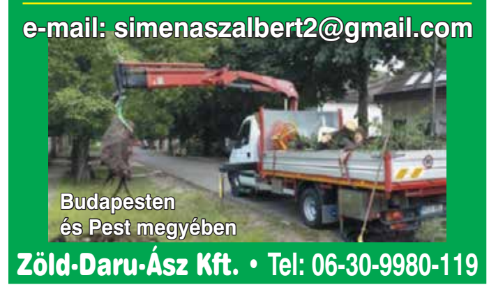
Budapesten és Pest megyében

Videokazetták VHS, VHS-C, H18 hanglemezek, hangkazetták, régli képek, filmek DIGITALIZÁLÁSA CD, DVD készítés Ferenci Videó 405-5919, 06-20-9392-658 XVI. Hermina út 16.