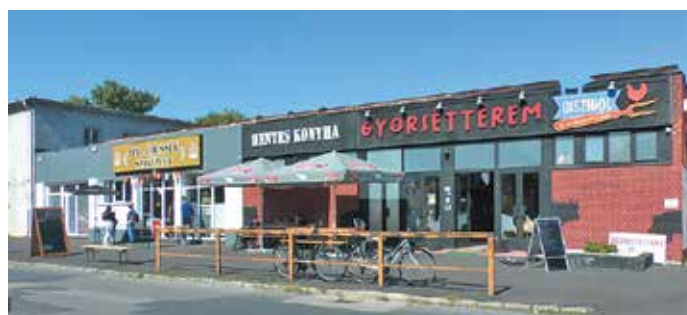
Az elmúlt egy évben készült el a valamikori főbejárat átépítése, ahol egy népszerű gyorsétterem nyílt meg, mellette pedig Italdiszkont működik