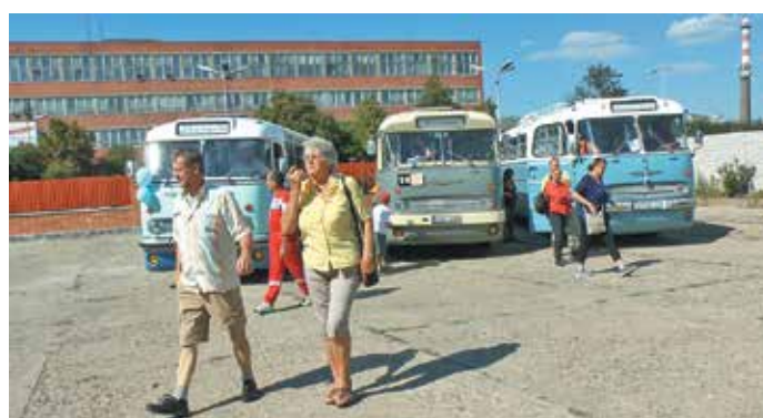
A nosztalgia járat utasai