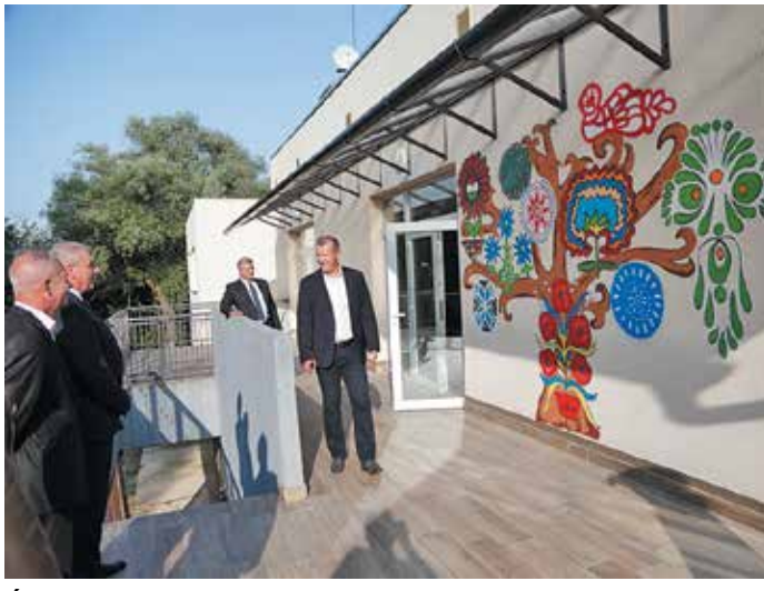
Életfa a terasz felől a nagytarcsai Helyőrségi Művelődési Otthont, a HeMo hátsó oldalán, melyet megtekintett legutóbbi látogatásán Szabó István, a Honvédelmi Minisztérium honvédelmi államtitkára Rimóczi Sándor polgármester társaságában

Ekkor a polgármester módosította az eredeti szerződést: részletezték a cég által elvégzett munkákat, meghatározták a bérlet (pontosságban az alberletbe adás) határidejét és a bérleti díjat. A Gigant Moda szerzett is alberlőnek egy pizzériát, aki nyomban birtokba vette a