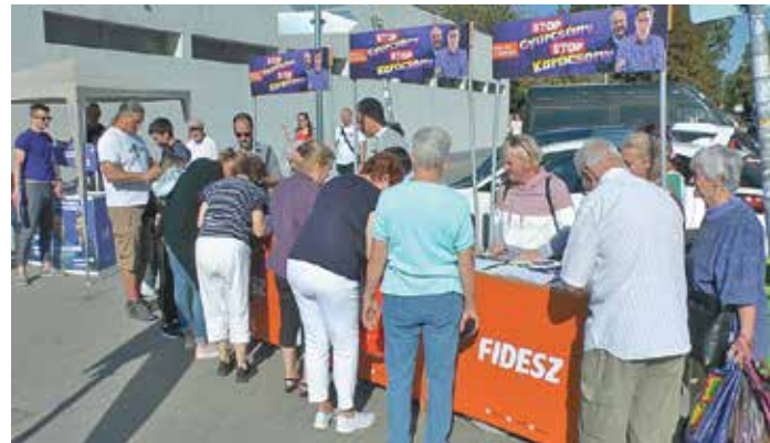
Stop Gyurcsány – Stop Karácsony kampány a piacon

Az ellenzéki előválasztás szervezői olyan támogatókat is keresnek, akik jellepeken hajlandók örökre fogadni egy előválasztási sátrat. Egy sátor felállítás, működtetése több száz-ezer forintjába kerül a szervezőknek, ennibe van a helyszín kialakítása, az áramellátás, a széles sávú internet biztosítása, illetve a sátrak őrzése, stb. Aki anyagilag is támogatni szeretné az előválasztást, ezen a webcímen teheti meg: https://elovalasztas2021.hu/tamogatasi/