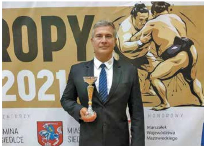
... és mint sportvezető egy szumóbajnokságon

vezetők mellett a hivatal első embere is részt vett. A Kertváros SE repertoárjába – mely klubnak tavaly óta hivatalosan az elnöke is –, pedig neki is köszönhető a birkózás és szumó mellé időközben a ritmikus gimnasztika, a röp-labda és a strandröplabda is bekerült.