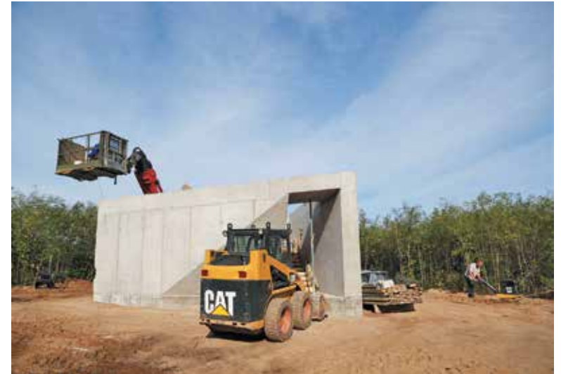
A kész fogadószintről indul a kilátó faszervezete

Augusztusi számunkban adtunk hírt arról, hogy megkezdődik a kilátó építése a Naplás-tó melletti kiserdőben. A hír forrása maga az építető volt, mivel a látványterv és maga a hír is a Pili-si Parkerdő portálján jelent meg. Aztán heteken át hiába jártunk a tervezett építkezés helyszínére, semmi nem történt: egy magányos pózna állt ki a magonc fiatal