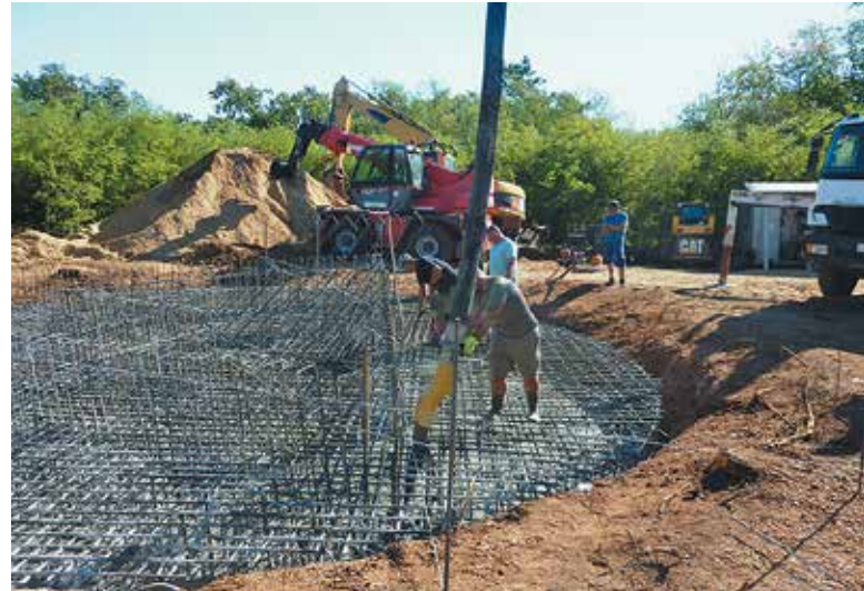
Betonnal öntik ki a gigantikus betonvas-szerkezetet