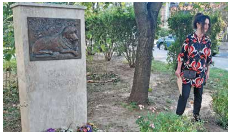
A szoborséta egyik szereplője, Beni kutya

A következő hetekben több új vagy ritkán tartott városnézésre invitáljuk a múltunk izgalmas történeteire kíváncsiakat. Eddig csak hétköznap zajló sétákat most hétfvégén is megszervezzük. Megemlékezünk 1956-ról és Trianonról is.