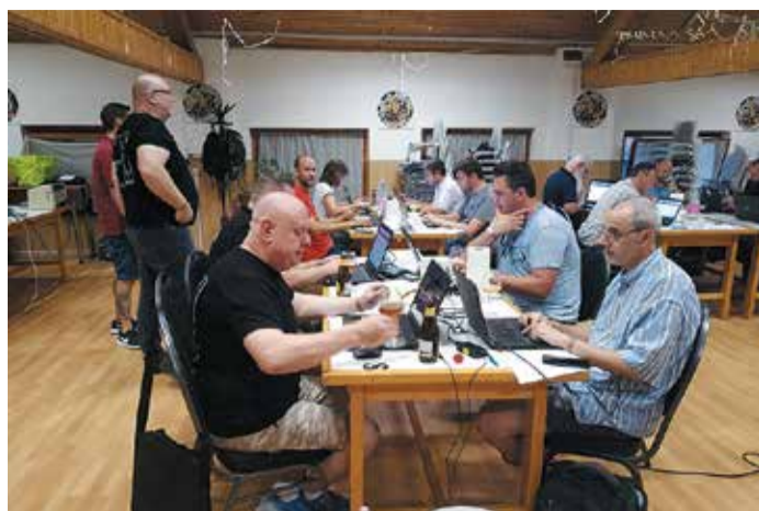
35 magyar „pályaművet” értékelt a zsűri

– Az volt a célom, hogy népszerűsítsem a házi sörfőzést, amely anno engem is magával ragadott, illetve, hogy a sörfőzés iránt érdeklődők minél több praktikus információhoz juthassanak – mondta a főszervező.