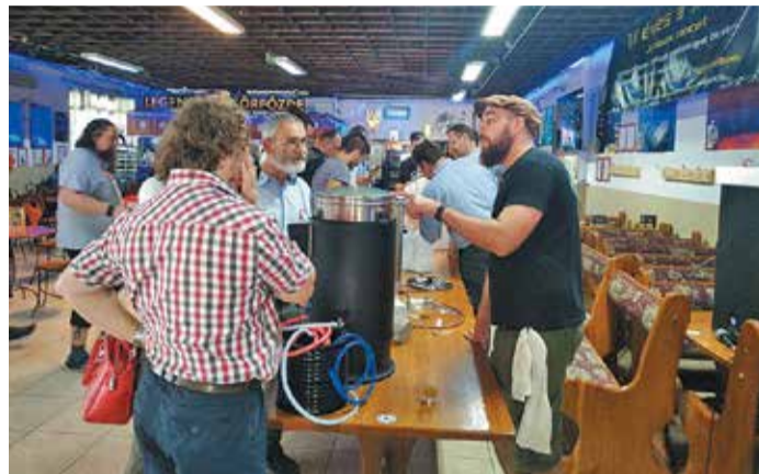
A sörfőző eszközök mellé jó tanács is járt

üzlet sehol máshol nincsen, így Záhonytól Sopronig minden sörfőzőt ez a két üzlet lát el jó minőségű malátával, komlóval, illetve az egyéb eszközökkel.