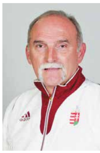
Hóbor Béla röplabda-játékos volt valamennyi magyar mérkőzés televíziós szakkomentátora

A KSE Röplabda Szakosztálya 2012-ben alakult. Jelenleg 110 gyerek üti (és fogadja) a labdát a klub színeiben. Az idei tornának és bajnokságoknak már két-két serdülő- és gyermek-, illetve mini-, szupermini- és több manócsapatot is indítanak majd. Az edzőik szerint az, hogy testközelből láthatták Európa legjobbjait, az ő fejlődésükre is pozitív hatást majd.