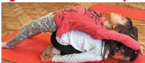
Gyermekjoga-gyakorlat: gyilk napozik a kövön

A gyermekjoga segítségével fejleszhető többek között a mozgáskoordináció, az egyensúly, az idegrendszer, a testtudat, a testtartás, a koncentráció, az érzelmi intelligencia. Gyakorlataink között megtalálhatók a nagymozgások, a gurulások, forgások, ugrások, keresztező gyakorlatok, végtagszétválasztó gyakorlatok, egyensúly-, koncentráció-, figyelem-összpontosító gyakorlatok, légzőgyakorlatok, relaxáció, valamint nagymozgásos játékok, érzelmi intelligenciát fejlesztő játékok.