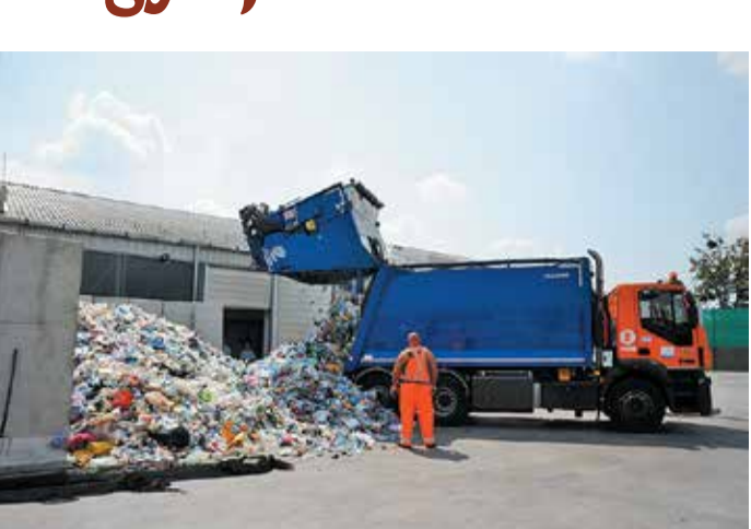
A műanyag-fém szelektív hulladékok ürítése a Büntetés-végrehajtás által fenntartott cég telephelyén, a Kozma utcában