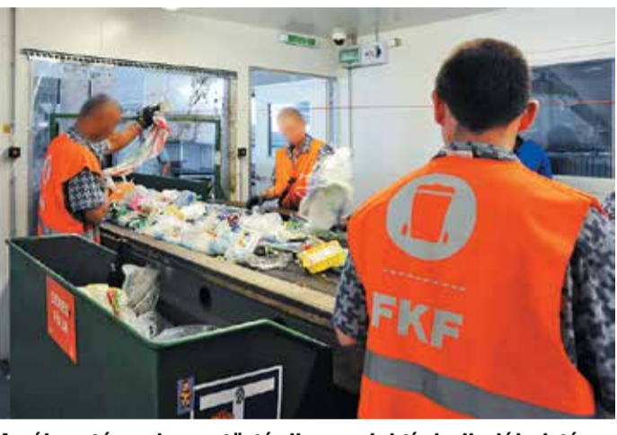
A válogató szalagon történik a szelektív hulladékok tényleges szelektálása a fogvatartott-foglalkoztatási program keretében. Az elítéltek kevés pénztér is keményen dolgoznak