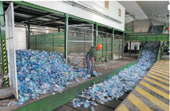
Ez már nem szelektív hulladék, hanem alapanyag

Kidobásra váró papír kétféle módon kerülhet egy háztartásba: hazaviszünk valamit, ami papírba/kartonba van csomagolva, illetve valamilyen nyomtatványként kerül hozzánk – jellemzően bedobálják a postaládába. Ezek többsége alkalmas a szelektív gyűjtésre, de azért vannak kivételek is. Egy telefüjt papírsebkendő, zsiros szalvéta nem a szelektívbe való, és bár a karton kiváló alapanyag, a pizzásdoboz helye sem a kék gyűjtőedényben van – legfeljebb akkor, ha róla az ételmaradékok teljesen eltávolították . Tejes és gyümölcsleves italosdobozok akkor kerülhetnek a szelektívbe, ha azokat nagyjából kiöblítették. A válogatóműben három papírféleség kerül kiválogatásra: a vegyes papír, a hullámpapír és az italos karton . Ezeket bálázják, majd papírgyáraknak továbbítják – hasznosítás előtt ezeknek az anyagoknak még további kezeléseket kell átmenük. A válogatóműben három papírféleség kerül kiválogatásra: a vegyes papír, a hullámpapír és az italos karton . Ezeket bálázják, majd papírgyáraknak továbbítják – hasznosítás előtt ezeknek az anyagoknak még további kezeléseket kell átmenük.